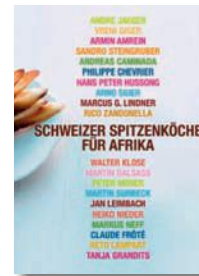
«Schweizer Spitzenköche für Afrika», AT Verlag, 39 Franken