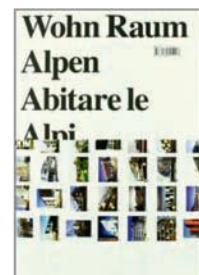
Peter Ebner: «Wohn Raum Alpen», Birkhäuser Verlag, 101 Franken

Das Buch dokumentiert mit eindrücklichen Bildern und anschaulichen Texten die Veränderungen seit dem Zerfall des Kommunismus. Es zeigt verschwindende Welten und Menschen auf der Suche nach einer neuen Identität.