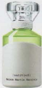
Duft Untitled ca. 100 Fr. von Maison Martin Margiela