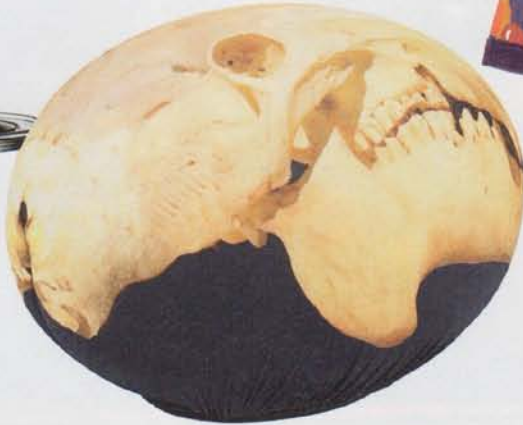
Fussessel von Baleri Italia ca. 540 Fr. bei Barneys.com