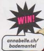
Bademantel Dolce Vita 459 Fr. von Christian Fischbacher