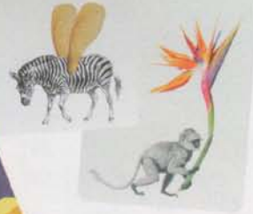
Postkarten von Younikat je 3 Fr. bei Changemaker.ch