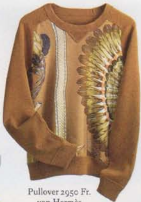
Pullover 2950 Fr. von Hermès