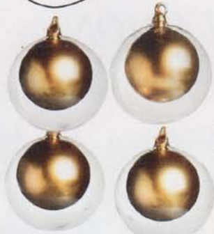
Weihnachtskugeln aus Glas von Ichendorf Milano, 4er-Set, ca. 55 Fr. bei Yoox.com