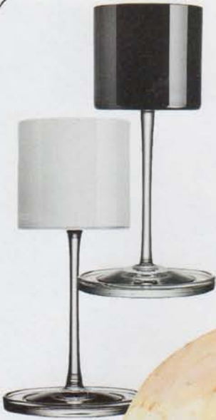
Gläser von Orrefors by Karl Lagerfeld je 202 Fr. bei Orrefors