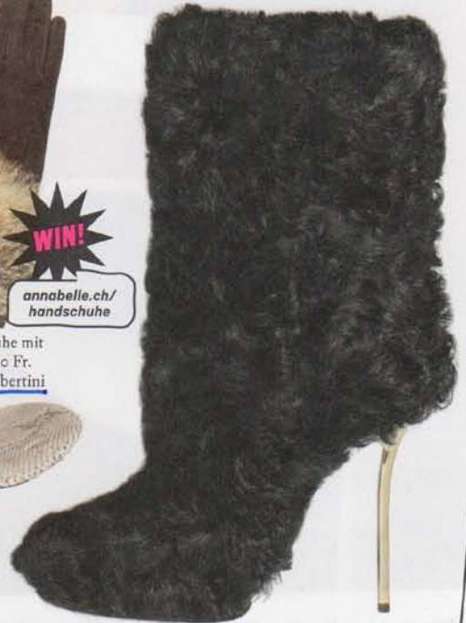
Fellboots mit Zigarettenabsatz ca. 1695 Fr. von Bally